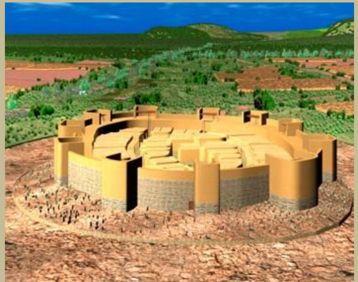
Els Vilars, Arbeka, Lleida. Fortificació ibèrica.